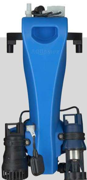
AQUAMAX® BASIC 1-16