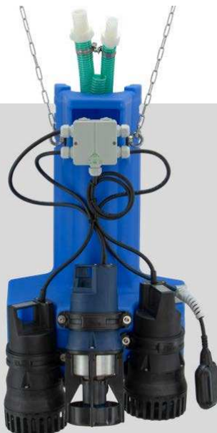
AQUAMAX® CLASSIC Z 1-16