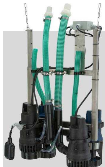
AQUAMAX® CLASSIC Z 17-50